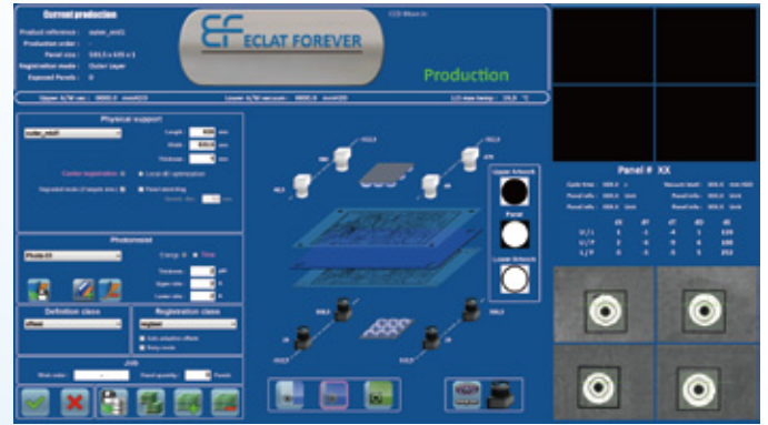
人機+統計製程管制